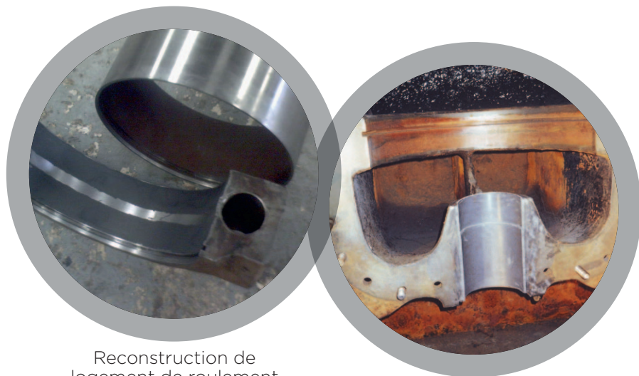
Reconstruction de logement de roulement