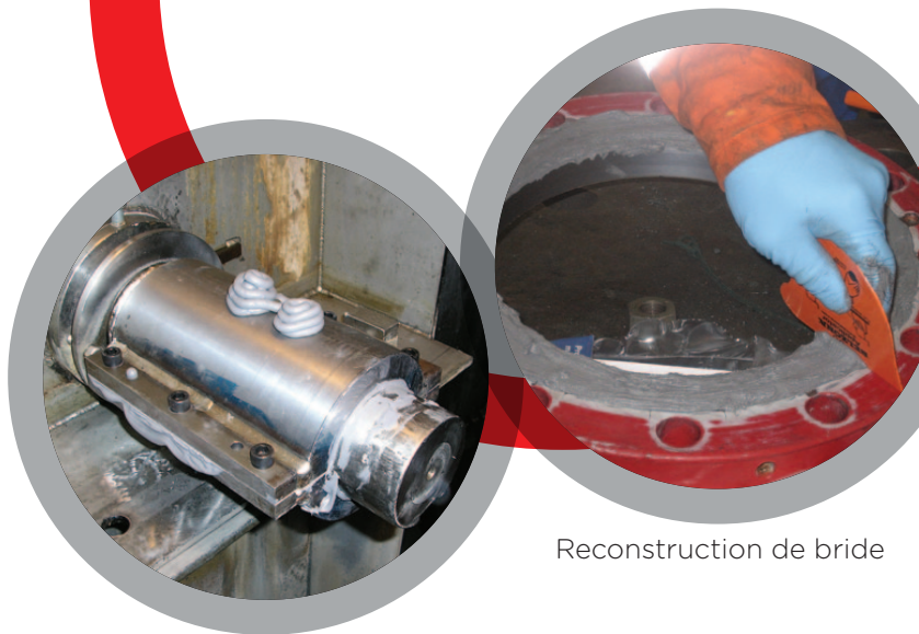
Moulage d'arbre in situ