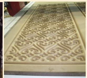
Gravure sur marbre