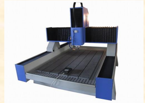
Machine de gravure du marbre