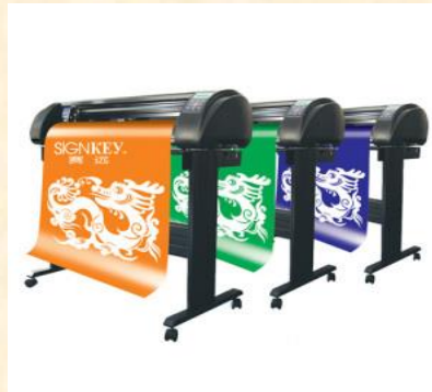
Ploter de découpe vinyle