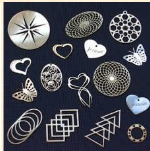
Gravure et découpe au Laser