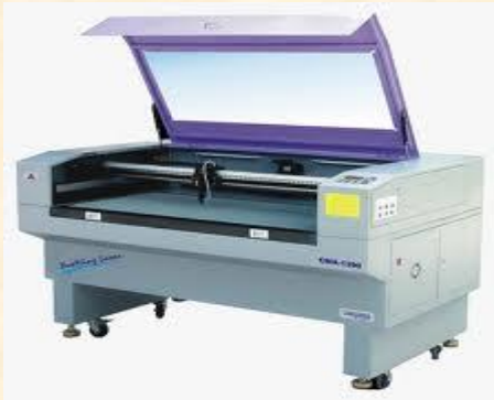
Machine de découpe au Laser