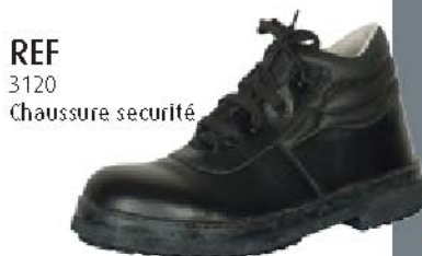
REF 3120 Chaussure sécurité