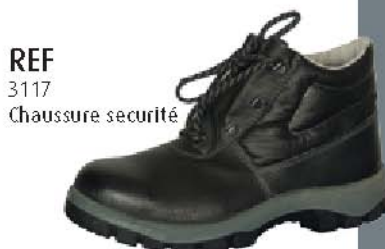
REF 3117 Chaussure sécurité