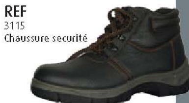
REF 3115 Chaussure sécurité