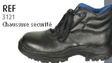
REF 3121 Chaussure sécurité