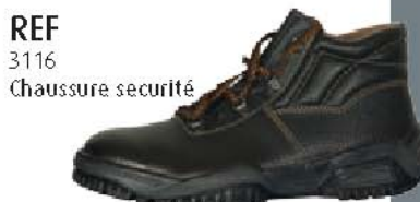
REF 3116 Chaussure sécurité