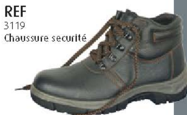
REF 3119 Chaussure sécurité