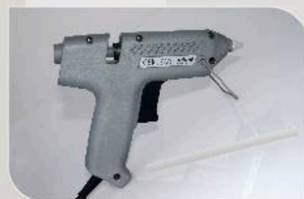
■ COLLE BATON