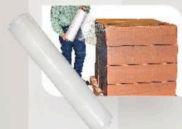
■ FILM ETIRABLE