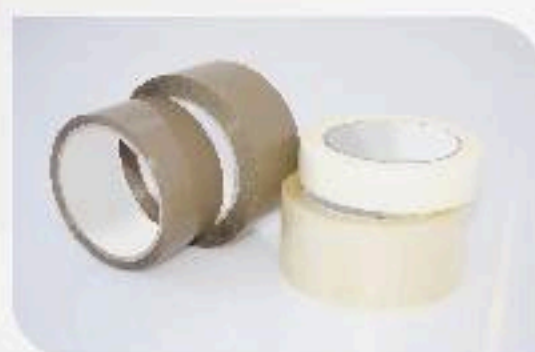
■ SCOTH & CREPE