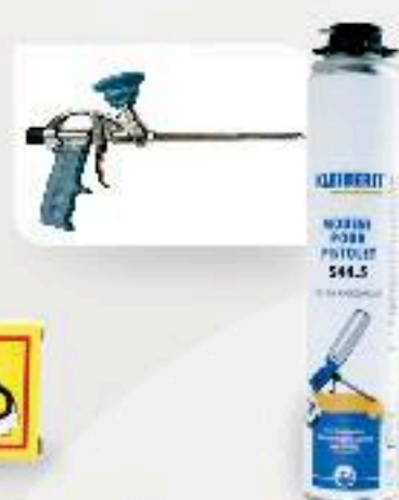
■ MOUSSE DE REMPLISSAGE