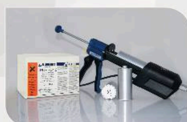
■ COLLE REACTIVE

Société Tunisienne de Produits Chimiques Tunis - 9 Rue des Métaux 2036 la Soukra Tel. : +216 71 940 269 / Fax : +216 71 940 279 Gabes - 228 Avenue Mohamed Ali 6000 Gabes Tel. : +216 75 274 644 / Mob : +216 24 500 984 stpc.colla@gnet.tn