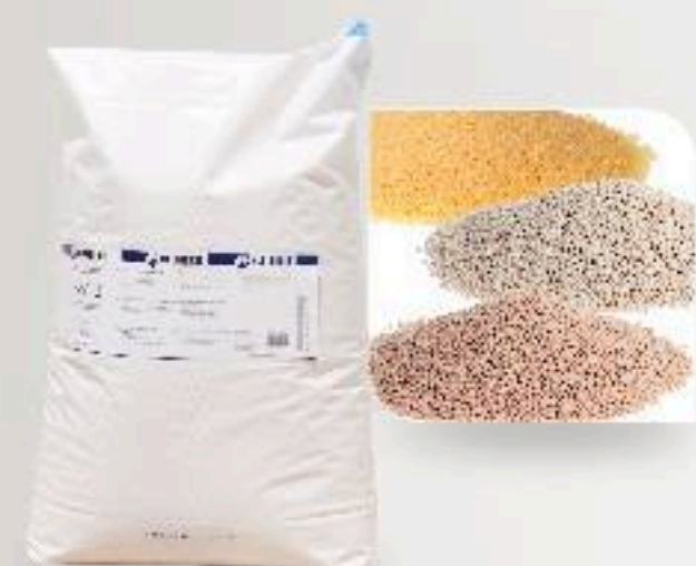
■ COLLE THERMOFUSIBLE